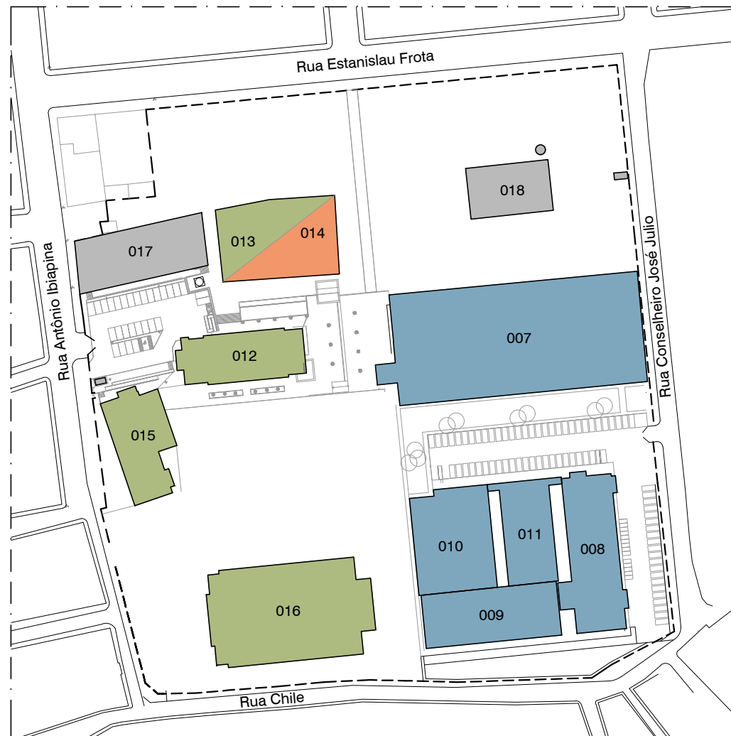
02 MAPA CAMPUS DE SOBRAL SETOR MUCAMBINHO ESCALA 1:2000